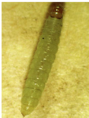
Ευδεμίδα. Προνύμφη πολύ ευκίνητη, μέχρι 1εκ. μήκος.