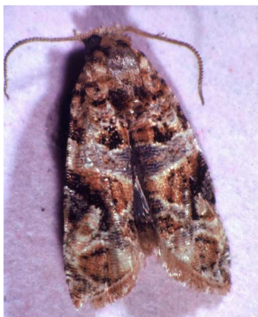
Ευδεμίδα. Τέλειο έντομο. Πεταλούδα περίπου 1εκ.