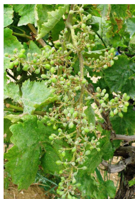
Ράγες σε ανάπτυξη

Τα κύρια βλαστικά στάδια ποικιλίας σουλτανίνα που εμφανίζονται αυτή την περίοδο είναι: